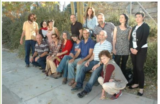
חלק מהסטודנטים והמרצים ביום הלימודים הראשון, תופסים שמש...

השבוע כבר הספקנו לדבר על התיזה שהעולם הולך ומתחיל, לעיין בפרוטוקולים ממשפטי מכשפות בני המאה ה-17, לעסוק בפילוסופיה הפרה-סוקרטית, ועוד מכל טוב.