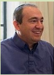
ד"ר אריאל פיקאר, חוקר יהדות עכשווית