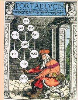
איור מפורסם של אילן הספירות, המאה ה-16

מסתבר שימים ספורים קודם לכן הראה לה סבה ז"ל בחלום את הסמל הזה והדגיש שעליה ללמוד להכיר אותו, כדי להבין טוב יותר את כתב היד שלו שהגיע לידיה באותה התקופה, כתב יד המבוסס על מסורת הקבלה.