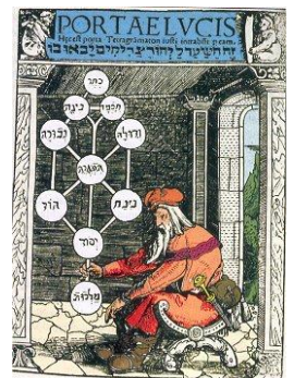
איור מפורסם של אילן הספירות, מכתב יד קבלי בן המאה ה-16

בואו ללמוד איתנו את מושיג היסוד בקבלה, זרמים, תקופות, מקורות ועוד... בקורס המבוא לתורת הסוד היהודית .