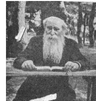
ר' הלל ציטליון (יצירה: אלמוג)

ועוד: מי ששם לב אל טבע הגעגועים, מי שהסתכל היטב אל תוך עצמו, אל הגנוז וטמון בכליון נפשו, הוא ידע, כי לא אל מה ששואף אנו מתגעגעים, כי אל מה שלא כאן, אל מה שאיננו יכולים לזכות בשם, אל מה שלא יחולו עלינו אקר ודברים. ("ה' הלל ציטליון, 'על גבול שני עולמות', עמ' 42) הקטע המלא באיגרת המלאה