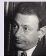
פרופ' גרשם שולם, מייסדי חקר הקבלה