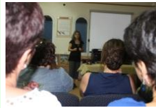
בפאנל האקדמי במושב עמיקים החיינו את המיתוס