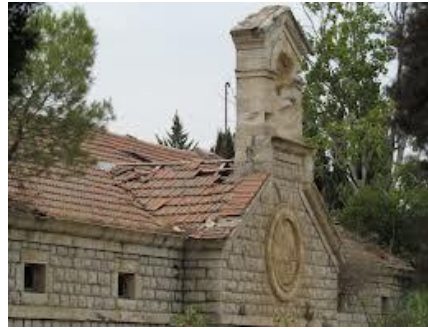
הדמנות אחרונה לראות את בית בוסל לפני השיפוץ

בהתמסרי להתגלות החושים איבדתי את הדחף של ישותי שלי, חלום המחשבות, כך נדמה, מטשטש אותי לגדול ממני את עצמיותי, אבל כבר קרבה ואותי מעוררת בזוהר החושים, חשיבת העולם."