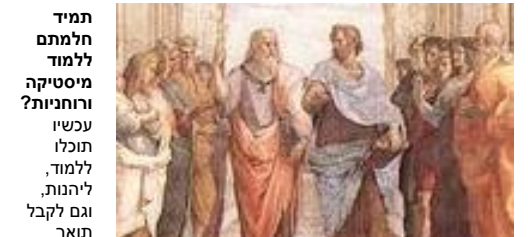
פילוסופיה – אם כל ענפי המדע ביוון העתיקה – עדיין מרתקת סטודנטים בימינו, אבל פחות בוחרים בה בפועל...

למרות זאת, סטודנטים ישראליים נוטים לבחור במקצועות שאינם אוהבים, מתוך מחשבה שהם יועילו להם כלכלית בעתיד. סקר ישראלי שנערך לפני חודשים אחרונים על ידי מכון שלם חשף מה סטודנטים באמת רוצים ללמוד. כ-80% מהסטודנטים אמרו, כי אילו לא היו להם דאגות כלכליות, היו בוחרים מקצוע אחר. תחומים כמו פילוסופיה, ספרות, אמנות וגיאוגרפיה זינקו בתסריט הזה, במאות אחוזים. לימודי הפילוסופיה למשל היו מזנקים בכ-1500%!