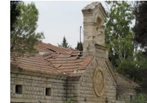
בית בוסל יוסופץ