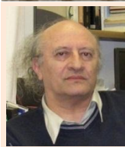
פרופ' משה אידל, מחשובי חוקרי הקבלה בעולם, היועץ האקדמי של החוג למיסטיקה ורוחניות