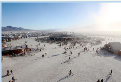
"BM 2010 Centre Camp"

בהמשך לפניות הציבור, הבהרה: אנחנו "החוג למיסטיקה ורוחניות" "החוג למיסטיקה" זה משהו אחר... ☺