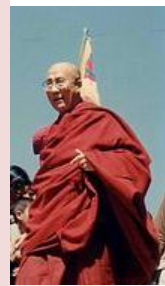
סנדזן גיאטסו, הדלאי לאמה ה-14

כך מצטטים אותו ברחבי הרשת (באנגלית, כמובן):