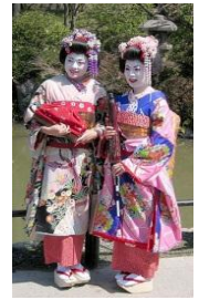
בוגרי B.A. יפן מחכה לכם עם מילגת מחקר