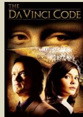
צפו בטריילר ב אתר הסרט "צופן דה-וינצ'י"