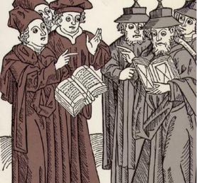
חיתוך עץ של יוהאן פון ארמסטריום (1483), המציג ינוח דהיי בן מלומדים נוצרים (משמאל) ויהודים העברית.

מכון הגליל למחקר ביהדות ונצרות (במכללה האקדמית עמק יזרעאל) מכריז על התחרות הבינלאומית הראשונה בכתיבת חיבורים בנושא: מדינת ישראל ותפקידה בעתיד יחסי יהודים-נוצרים .