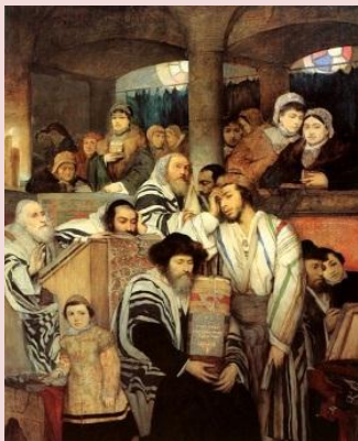
ציורו של מאוריצי גוטליב, יליד גליציה (1878): "יהודים מתפללים בבית הכנסת ביום הכיפורים"

במוסד הרצל שבאוניברסיטת חיפה הוקם פרויקט מחקר על אוניברסיטאי, רב תחומי ובינלאומי, העוסק בחקר יהודי גליציה ובוקובינה תחת שלטונה של הקיסרות האוסטרו-הונגרית – מאמצע המאה ה-18 עד 1914.