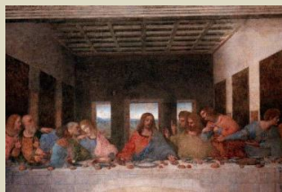
הסעודה האחרונה לליאונרדו דה-וינצ'י – הקליקו וצפו בהגדלה . איך זה קשור? תצטרכו לקרוא את הספר של בראון כדי לדעת...

הספרות הגנוסטית הפכה נושא מרכזי במסגרת סיפורים אלטרנטיביים וחתרניים ברוחניות העידן החדש על תולדות הכנסייה, ישו ושליחיו. סיפורים אלה מציגים אינטרסים סמויים של הממסד הנוצרי (למשל הוותיקן) לרדוף קבוצות סודיות "כופרות", כגון מכשפות או "הבונים החופשיים", וכמובן את הגנוזים. "צופן דה-וינצ'י" (לדן בראון) הוא דוגמה פופולרית לסיפור מעין זה, והספר אף זכה לגרסה קולנועית מצליחה.