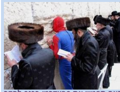
האם תפגשו את ספיידרמן בכנס לחקר רוחניות עכשווית?

השנה ייערך הכנס בפעם החמישית, ולראשונה באתר חדש – אוניברסיטת תל-אביב. הוא יתקיים בימים ג'ד' 28-29/5/13.