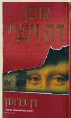
על הספר "צופן דה-וינצ'י" ביקפדיה