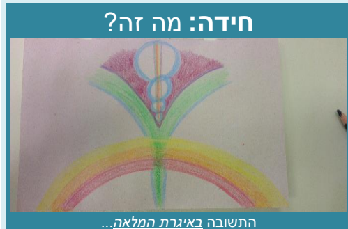
חידה: מה זה?

כשעוד לא היו שמים ולא הייתה ארץ, מהתהום נולדה הארץ. והוא בעצמו, ברא את אבן החסד, במקום שהוא שבו לא היו שמים וארץ, ומאבן החסד נולדו שבע אבנים קדושות ושבעה לוחמים ילידי הרוח המרחפים בעולם שהוא כולו רוח, שבע שלהבות קמו והיו, וכולן נעו במרחב הוא, ולשלהבות היו שבעה חסדים ושבעה רגעי קדושה. הרבה חסדים נולדו באותו עולם ומאותה אבן חסד.