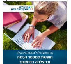
אנו טוחלים לכל הסמסטר שלנו חופשת סמסטר נעימה ובהצלחה בבחינות!