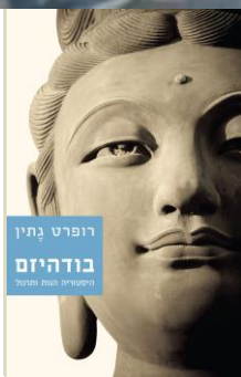
רופרט גתין בודהיזם היסטוריה, הגות ותרגול

דמי ההרשמה משכר הלימוד? ... קראו באיגרת המלאה