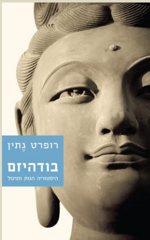
רופרט גתין בודהיזם היסטוריה הגות ותרגול

"המילה 'בודהה' אינה שם, אלא היא תואר, שמשמעו 'זה שהתעורר'. המסורת הבודהיסטית משתמשת בדרך כלל בתואר זה כדי לציין סוג של יצורים נדירים ביותר, כלומר יוצאים מן הכלל לחלוטין מנקודת הראות של בני אנוש רגילים. בניגוד לבודהות, שהם 'יצורים ערים', כלל בני האדם, כמו כל שאר היצורים והישויות הקיימים בעולם, ישנים – ישנים במובן זה שהם עוברים את חייהם בלי שהם אי פעם יודעים או רואים את העולם 'כפי שהוא' (yathā-bhūtam). ולכן הם סובלים. לעומת זאת בודהה הוא יצור שהתעורר ויודע את העולם כפי שהוא באמת, ולכן משתחרר מהסבל. יתר על כן – וזו אולי החשיבות הגדולה ביותר שיש לבודהות מבחינת שאר האנושות ולמעשה מבחינת כל היצורים ביקום – הבודהות מלמדים. הם מלמדים מתוך אהדה וחמלה כלפי כל היצורים הסובלים, לתועלתם ולרווחתם של כל היצורים; הם מלמדים כדי להוביל אחרים להתעורר לידיעה שמביאה שחרור סופי מהסבל." (ע"ע 26-27)