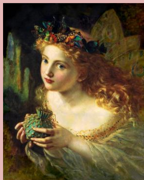
פיה (סופי אנדרסון, המאה ה-19)

פרופסור בריטי טוען שראה פיות ואפילו צילם אותן... קראו כאן.