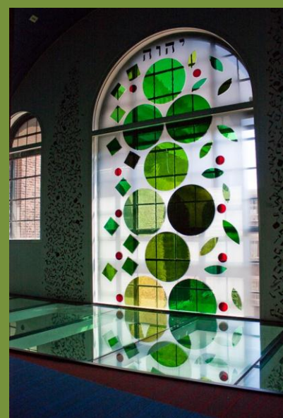
עץ החיים - ויטראז' מאת אלי קונטנט

(רמב"ם, מורה הנבוכים, ג' מ"ג; בתרגום הרב יוסף קאפח.)