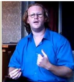
ד"ר אורי דייגין, מומחה לקבלה, פילוסופיה, היסטוריה וספרות יהודית, ולהשפעת הקבלה מוח לעולם היהודי