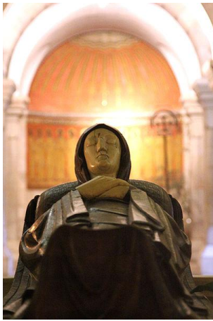
פסל מריה בכנסיית דורמציון, שם מצוי קבריה לפי המסורת