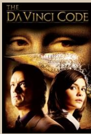
צפו בטרילר באתר הסרט "צופן דה-וינצ'י"