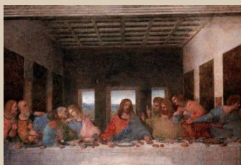
הסעודה האחרונה ליליאונרדו דה-וינצ'י – הקליקו וצפו בהגבלה איך זה קשור? תצטרכו לקרוא את הספר של בראון כדי לדעת...

מה הקשר בין גנוזיס לרוחניות עכשווית? מה זה פמיניזם רוחני? האם הרוחניות האלטרנטיבית קשורה לנצרות ואיך, או שבכלל לצופיות ואולי לבודהיזם? על כך בקורס המבוא לחקר רוחניות עכשווית. אולי מה שמעניין אתכם הוא בעצם רוחניות פמיניסטית, או קולנוע רוחני? – רק אצלנו בחוג למיסטיקה ורוחניות תמצאו את כל אלה. אל תחמיצו את כל הקורסים האלה בשנה הקרובה! צרו קשר לפרטים והרשמה!